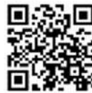
Buku Panduan sampah domestik

Buku panduan dapat dilihat dengan menggunakan aplikasi “San aru” pada smartphone maupun tablet.